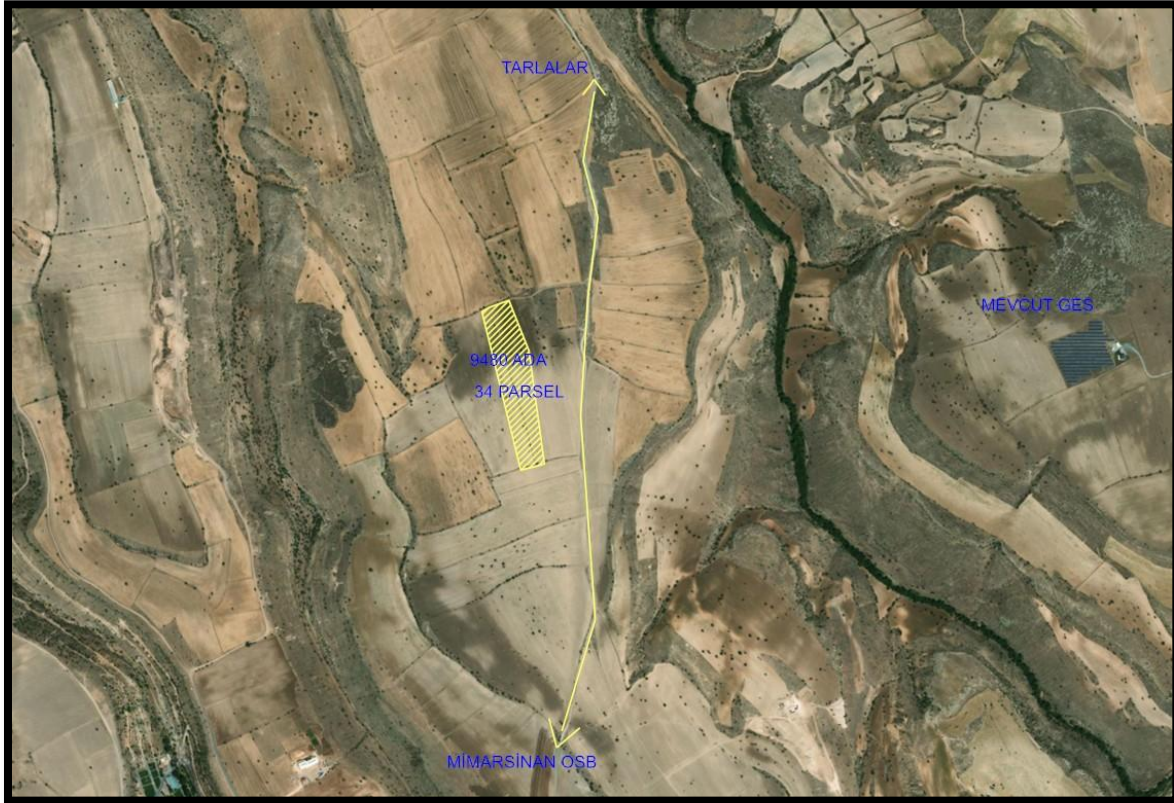
RESİM-1: Kadastro ve Uydu görüntüsü

koordinatları arasında kalan 9480 ada 34 parsel 1/25.000 Nazım İmar Planında “Tarım Alanı” olarak planlı olup, alanın 1/5000 Nazım İmar Planı ve 1/1000 Uygulama İmar Planı bulunmamaktadır. Enerji Üretim, Dağıtım ve Depolama Alanı (Güneş Enerji Santrali) olarak planlaması talep edilen alan yaklaşık 3 ha. büyüklüğündedir.